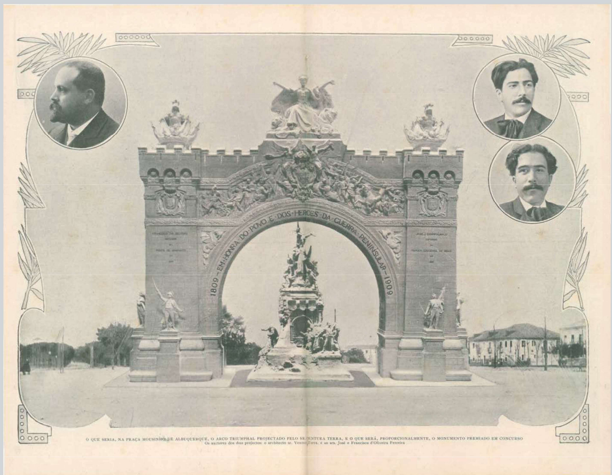
FIG. N.º 2 – A VITÓRIA DOS IRMÃOS OLIVEIRA FERREIRA NA IMPRENSA. ILLUSTRAÇÃO PORTUGUEZA , 5.4.1909.